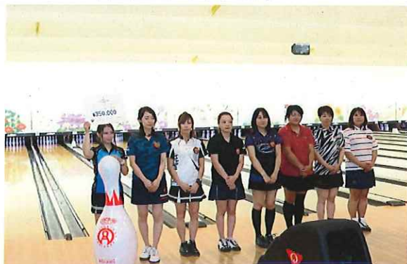
レギュラー女子部門の入賞者