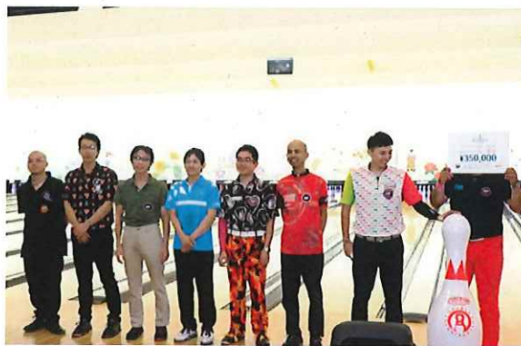
レギュラー男子部門の入賞者